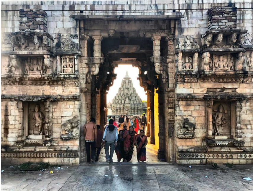
A Chittorgarh erőd egy történelmi kincsesláda, ami bepillantást enged az odalátogatóknak az egykori uralkodók életébe.